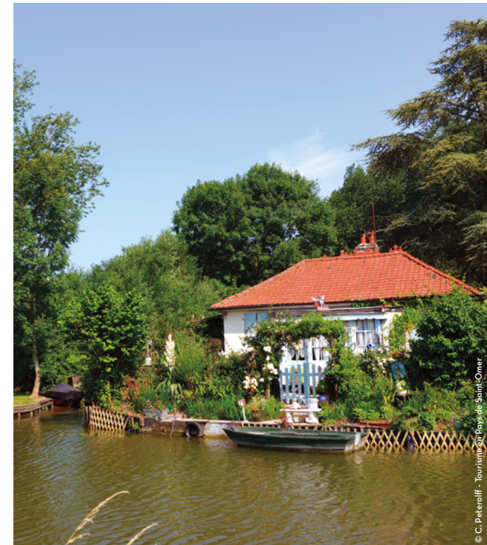
© C. Peteroff - Tourisme en Pays de Saint-Omer